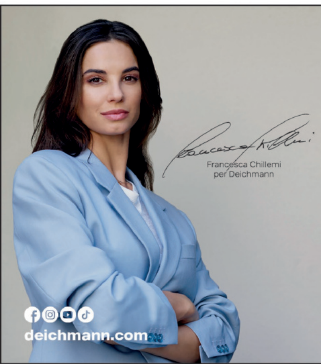
Francesca Chillemi per Deichmann