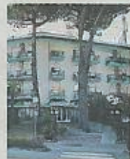
L'ingresso del "Vina de Mar"

Le cose, però, non vanno bene. «Dopo la raffica di disdette raccolte a inizio stagione, decido di assumere quattro dipendenti per arrivare, a fine estate, a dieci a fronte dei soldi quieti», prosegue Corso. «Cercando di contenere le spese mi sono sobbarcato lavoro aggiuntivo, cosa che hanno fatto anche i miei collaboratori comprendendo la necessità del momento. Ma, dietro la volontà di lavorare di alcuni, si cela una parte d'Italia, più o meno giovane, che preferisce