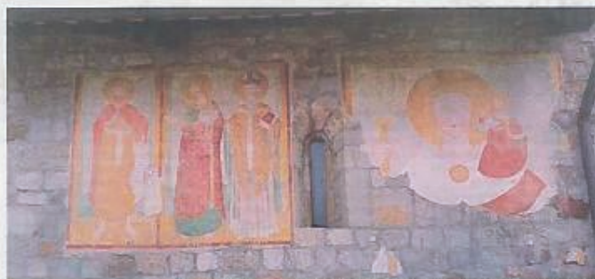
Accanto al trittico raffigurante S. Nicola, S. Giacomo e S. Giovanni, l'imponente figura di S. Cristoforo