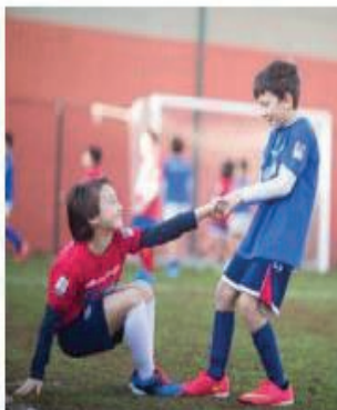
la salute e permette ai giovani di combattere sedentarietà e obesità? Questo qualcuno è a conoscenza che non praticare attività sportiva nuoce gravemente alla salute? E noi la

sport l'attività fisica di mantenimento nelle palestre private (con tutto il rispetto ma con dovoso distinguo) tra tutti, proprio lo sport giovanile di base. Siamo formati indietro di 60 anni in un colpo solo. A questo qualcuno vorrà dire che gli sono sfuggiti alcuni particolari importanti e fra essi forse quello più importante: lo sport giovanile non è solo divertimento o passatempo (che già da soli pur fanno socialità, ovvero una delle caratteristiche umane più importanti) ma anche e soprattutto benessere fisico. Come si può impedire ai giovani di fare attività sportiva, in una nazione che primoglia in Europa, unitamente alla Cina, per l'obesità infantile (6/9 anni)? Come si può, in nome della protezione della salute pubblica, bloccare l'attività che più di tutti detiene