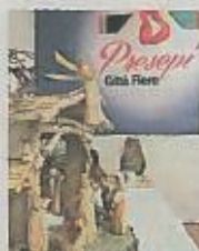
Un presepe al Città Fiera

Dalla riscoperta della bellezza del saper fare, nasce la "Rassegna Presepi", che da oltre vent'anni prende vita a Città Fiera per valorizzare il tema della natività.