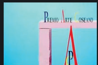
Premio Arte Coseano