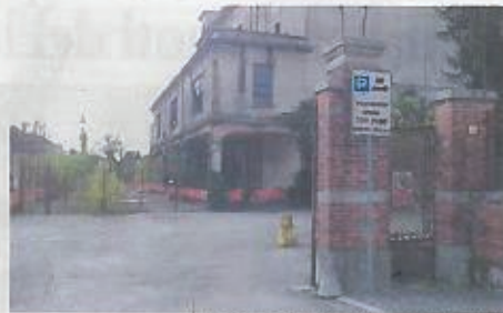
Il parcheggio dell'ex frigorifero, in via Sabbadini, a Udine