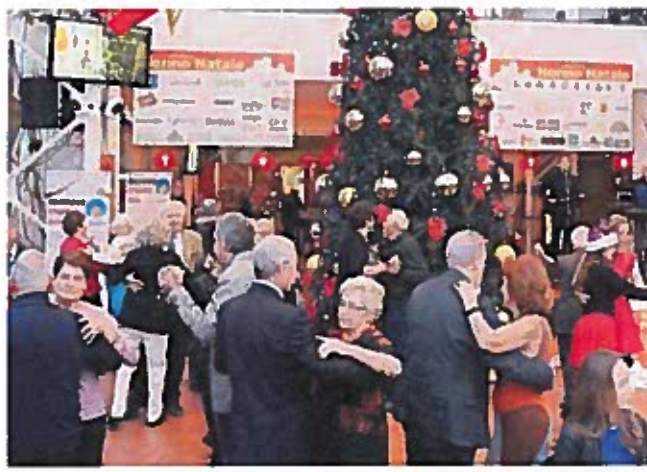
Nella foto: un momento della grande festa «Nonno Natale», lo scorso 26 dicembre al Città Fiera.

Bilancio positivo per le iniziative sociali dedicate al Natale al Città Fiera di Martignacco: è stato infatti raggiunto il record di affluenza di pubblico e di proventi raccolti da destinare alle associazioni del territorio. Tra gli appuntamenti più importanti la «Rassegna presepi» al primo piano del centro commerciale, prorogata fino al 16 gennaio, e «Nonno Natale» che dal 2003 tradizionalmente si svolge il 26 gennaio sempre all'interno del Città Fiera e che quest'anno ha visto la partecipazione di 500 anziani del territorio. «Siamo orgogliosi di queste iniziative, la partecipazione è stata davvero grande, al punto che abbiamo deciso di prorogare la «Rassegna presepi», che avrebbe dovuto concludersi il giorno dell'Epifania, fino al 16 gennaio quando ci sarà la festa per ringraziare tutti e per premiare i presepi più votati dal pubblico», spiega Melina Canelli, responsabile delle attività sociali del centro commerciale. La mostra ha visto la partecipazione di 70 espositori privati e di una quindicina di associazioni, tra le quali il «Centro di aiuto alla vita» onlus di Udine. Grande l'entusiasmo anche per Nonno Natale, il pranzo a