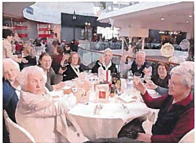
Nella foto: una delle precedenti edizioni di «Nonno Natale» al Città Fiera.

«Per noi è fondamentale dare un significato profondo alle festività. A Natale ci sono tanti anziani che sono rimasti soli e che hanno bisogno di compagnia. Il nostro scopo è condividere del tempo con loro e regalargli una giornata