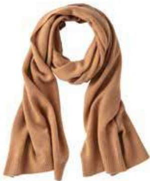
↑ Sciarpa 100% cashmere beige by C&A

Una giornata di shopping non vi basterà per scoprire tutte le proposte moda di Città Fiera, che raccontano le tendenze per la nuova stagione autunno/inverno. Direttamente dalle passerelle torna l'animalier, uno dei trend stagionali più longevi degli ultimi tempi, ma la novità stagionale è sicuramente il colore. Anche d'inverno.