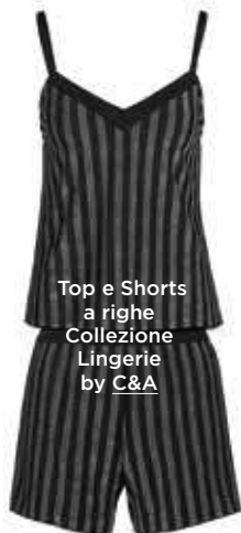
Top e Shorts a righe Collezione Lingerie by C&A