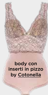
body con inserti in pizzo by Cotonella