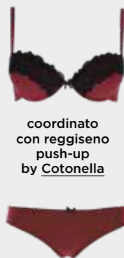
coordinato con reggiseno push-up by Cotonella