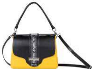
↖ Borsa da giorno O bag glam con pattina athleisure by O bag