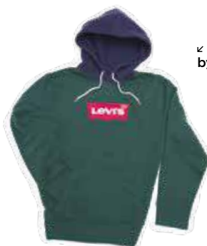
↙ Felpa verde by Levi's