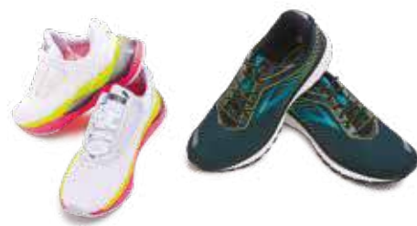
↗ Sneakers Nike by Mega Intersport