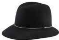
↖ Cappello 100% lana by C&A