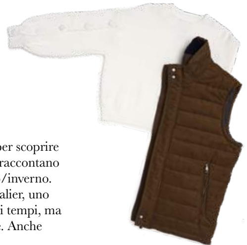
↗ Pullover check Gilet eco camoscio cognac by Mango

Ed infine c'è la notte. La femminilità incontra un'eleganza d'altri tempi per un ritorno al new glam, interpretato in chiave notturna, misteriosa, sensuale e a tratti gotica in un tripudio di pizzi e frange.