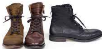
↗ Adrein Stivale in pelle by ALDO