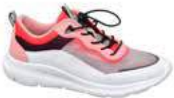
↙ Sneaker fluo con dettagli multicolor donna by Deichmann