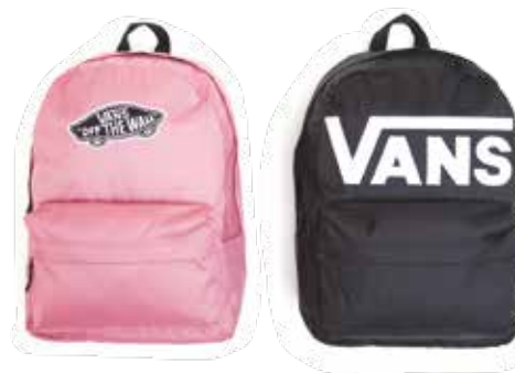
➤ Zaini Realm e Old Skool III by Vans

Amate dalle celebrità come dai fan dello streetwear, le scarpe Vans Old Skool sono tra i modelli più riconoscibili e di fama globale. Le linguette imbottite offrono comfort mentre sei in movimento, mentre le soles a nido d'ape forniscono maggiore stabilità e supporto. Le scarpe da skate Vans Old Skool fanno parte di una serie di collezioni di iconiche sneakers Vans, come le Vans Authentic, le Vans Era, le Vans Slip-Ons e le Vans Sk8-Hi. Ogni modello di questa collezione ha dei chiari richiami ai dettagli dei classici modelli Off the Wall.