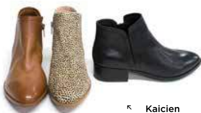
↖ Kaicien Stivaletto in pelle by ALDO