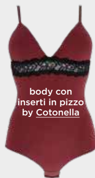
body con inserti in pizzo by Cotonella

Una collezione femminile intima sontuosa, articolata in 5 serie e dedicata a chi ama i colori insoliti, sensuali, misteriosi, e capi intimi visivamente appaganti, ma soprattutto confortevoli, realizzati con la cura e la qualità Cotonella di sempre.