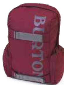
➤ Zaino Burton by Storage