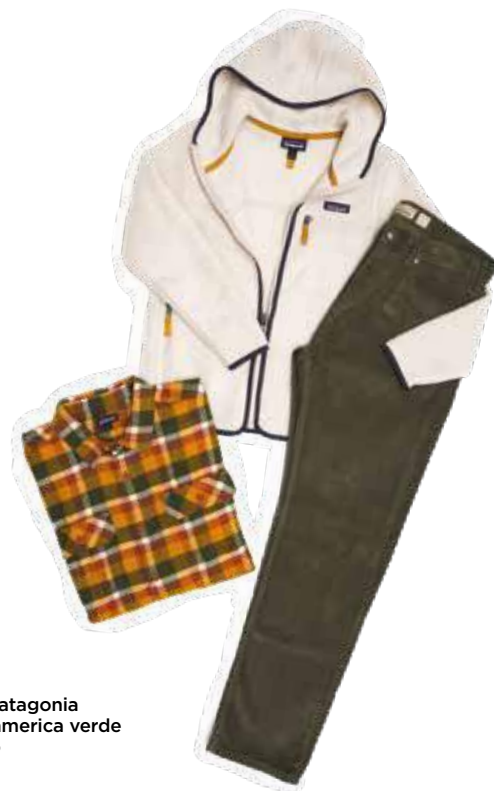
↗ Felpa orsetto Patagonia Camicia check oldamerica verde Pants cargo techno verde Patagonia by Mega Intersport