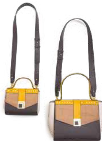
↗ Borsa piccola e grande palette giallo Marella by B/store