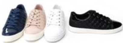
↖ Groeria Sneakers trapuntata in ecopelle by ALDO