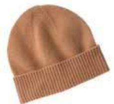
↗ Cuffietta 100% cashmere beige by C&A