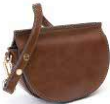
↑ Borsa tracolla mezzaluna marrone by Mango