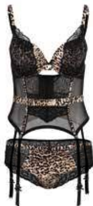
Baby doll e slip con inserti animalier Collezione Lingerie by C&A