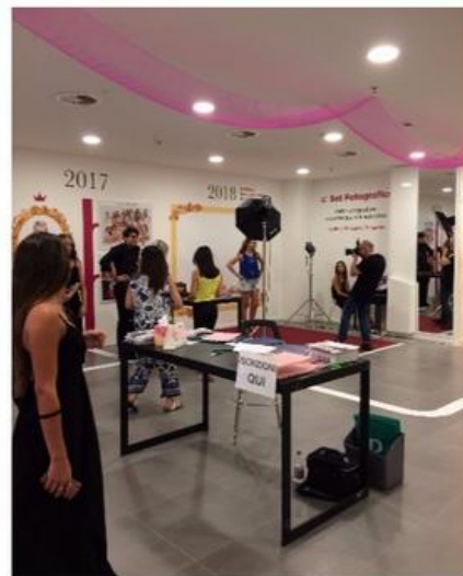
Casting Città Fiera a Udine – backstage

Spero che questi consigli fisici ti siano utili, qui trovi una raccolta di consigli psicologici per il perfetto casting da modella (e non solo) e qui ti svelo il segreto per piacere a tutti .