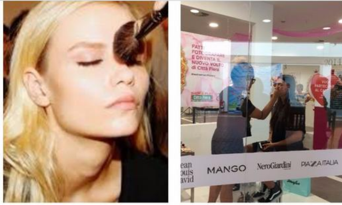
Backstage città fiera – Udine

Dal make up alle mani, il nostro biglietto da visita. No a unghie mangiucchiate o a colori extra-strong , sì all'effetto naturale, meglio senza smalto. Qui ti svelo come rinforzare le unghie mentre, se sei senza speranze, ecco una gallery di unghie effetto nude .