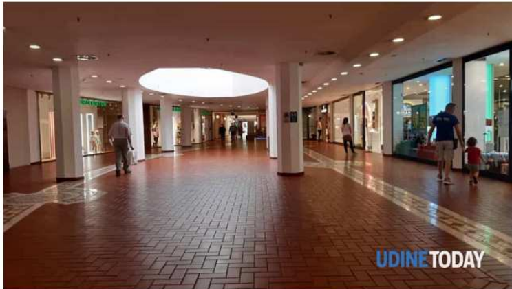
L'interno del Città Fiera alla riapertura