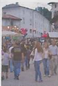
«Aria di festa» a San Daniele