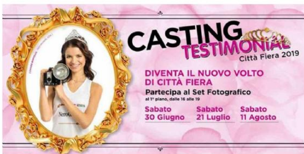
Casting Testimonial Città Fiera 2019: ultima chiamata sul set (CITTÀ FIERA)

MARTIGNACCO - Ultima chiamata sul set per trovare il nuovo volto di Città Fiera per la settima edizione dell'evento Testimonial 2019. Un evento organizzato in collaborazione con Miss Alpe Adria International, che di anno in anno coinvolge centinaia di ragazze dai 15 ai 30 anni con la passione per la moda e le sfilate. Diventare Testimonial è infatti un'opportunità per tutte le ragazze, esperienza che le porta a vivere l'emozione di un set fotografico e di una passerella di moda.