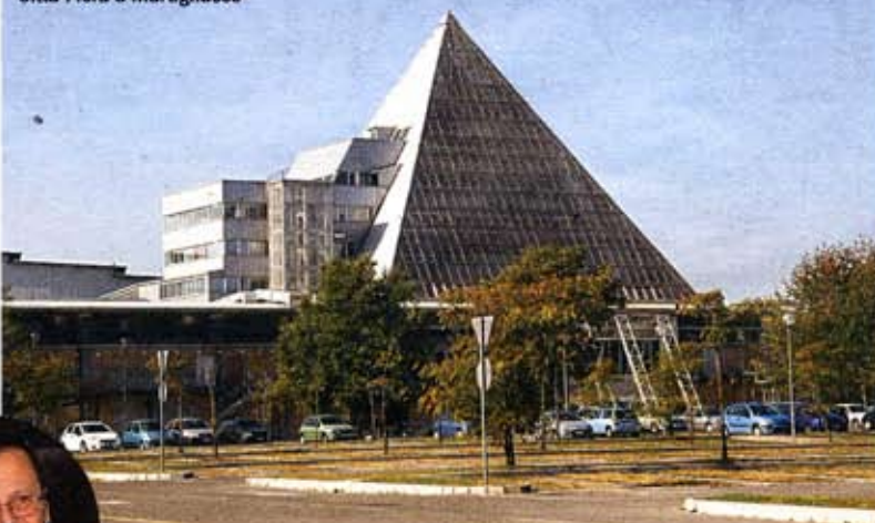
Il centro commerciale Città Fiera a Martignacco

con la convinzione che avrebbero rappresentato il futuro anche in Italia. La mia marcia è cominciata proprio dal Città Fiera che rappresenta la mia principale occupazione".